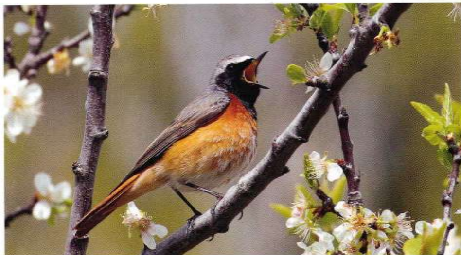
© Jean-Michel Thibault - Phoenicurus phoenicurus